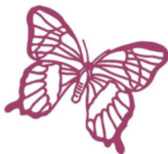
Association Lupus Erythémateux